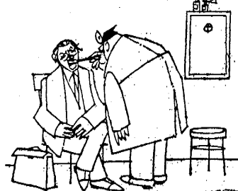
"Aber eine richtige Silberzunge ist das nicht - hier und da kommt auch schon schlichtes Bloch durch."